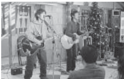
「センタープラザX'masコンサート」のイベント(昨年12月、熊本交通センター地下)に出演

そんな中で、それぞれのイベントや路上で沢山の出会いがあり、熊本には色々な人々がいることに気付くことが出来ました。そして、その人々の頑張っている姿を見ていると、一人一人がそれぞれの熱い思いを持っていることが伝わってきます。